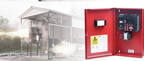
Alarme e supressão de Incêndio FIKE