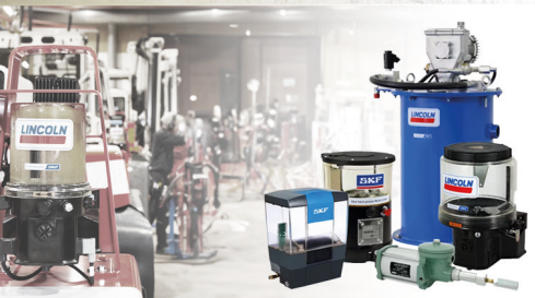
Lubrificação Automática Lincoln | SKF