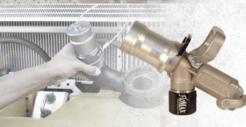
Abastecimento Rápido FLOMAX