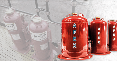
Supressão de Incêndio AFEX